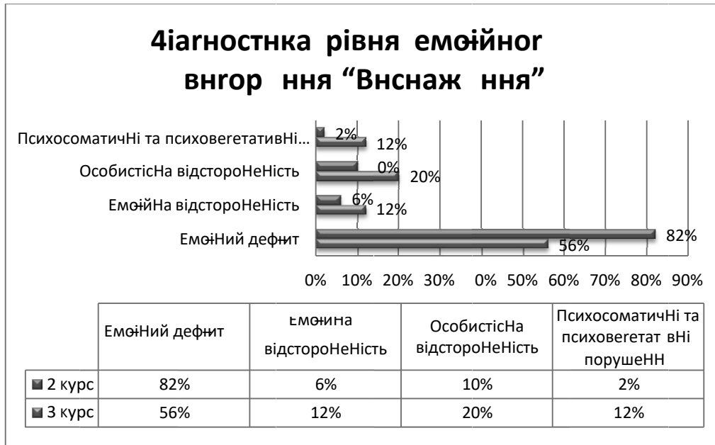
Рис. 4. Дослідження провідних симптомів фази «Виснаження».

Оцінка рівня тривожності виявила високий рівень ситуативної та особистісної тривожності у студентів третього курсу – 74% і 70% відповідно. Для студентів другого курсу характерні середні рівні: у 72% – середній рівень особистісної тривожності, у 50% – середній і 46% опитуваних – високий рівень ситуативної тривожності.