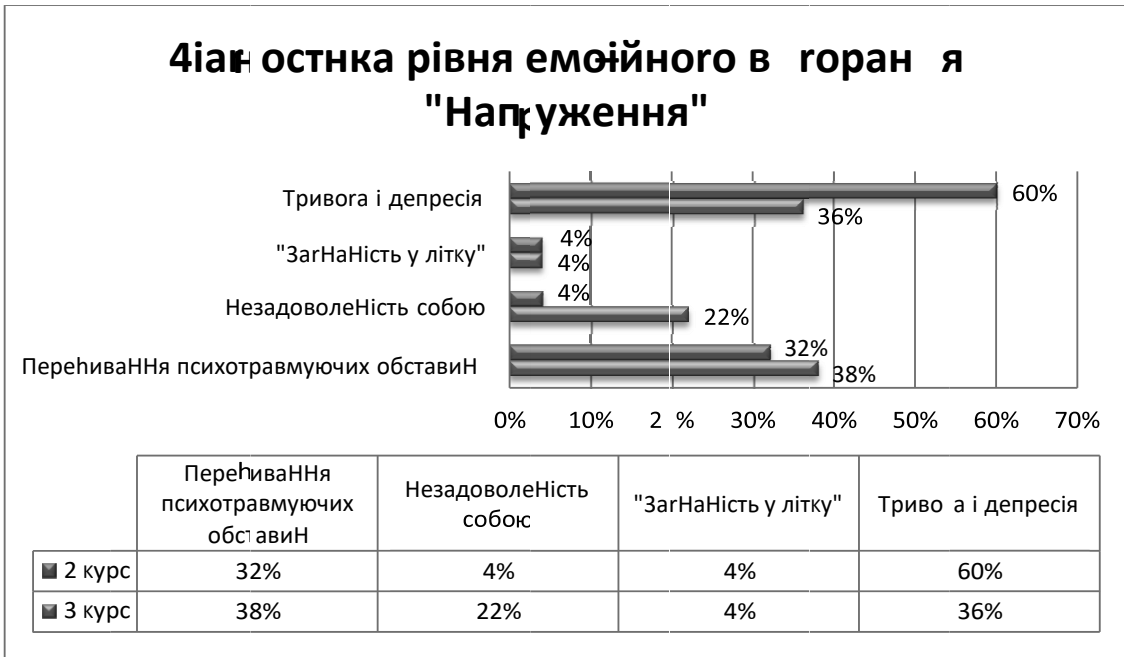
Рис. 2. Дослідження провідних симптомів фази «Напруження».

Для фази резистентності провідними симптомами є емоційно-моральна дезорієнтація (у 28% другого та 40% студентів третього курсів) та неадекватне емоційне ви-