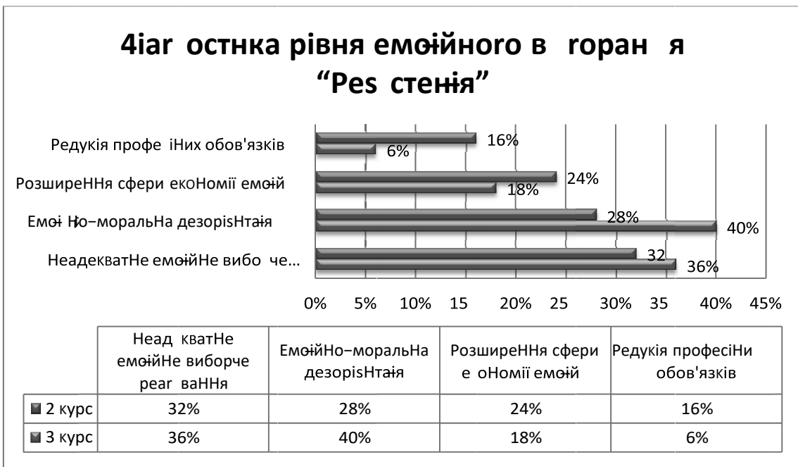
Рис. 3. Дослідження провідних симптомів фази «Резистенції».

борче реагування, що проявилися у 32% опитаних другокурсників і 36% третьокурсників (рис. 3).