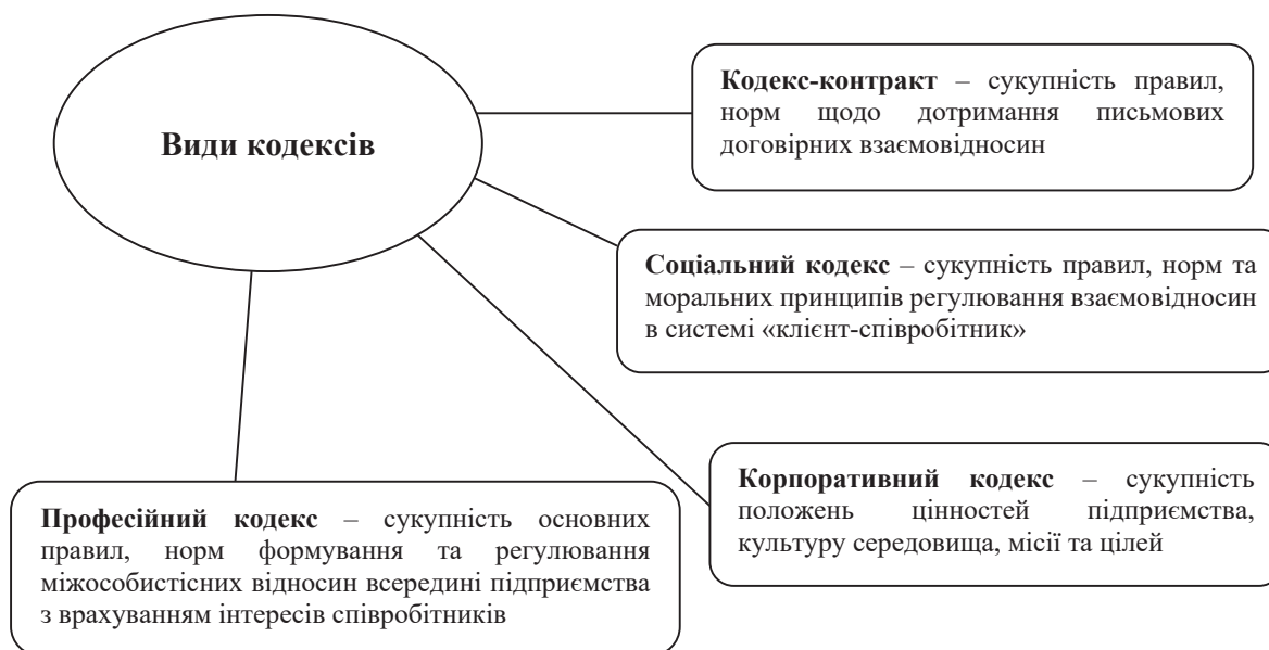
Рис. 1. Види кодексів етики в бізнесі