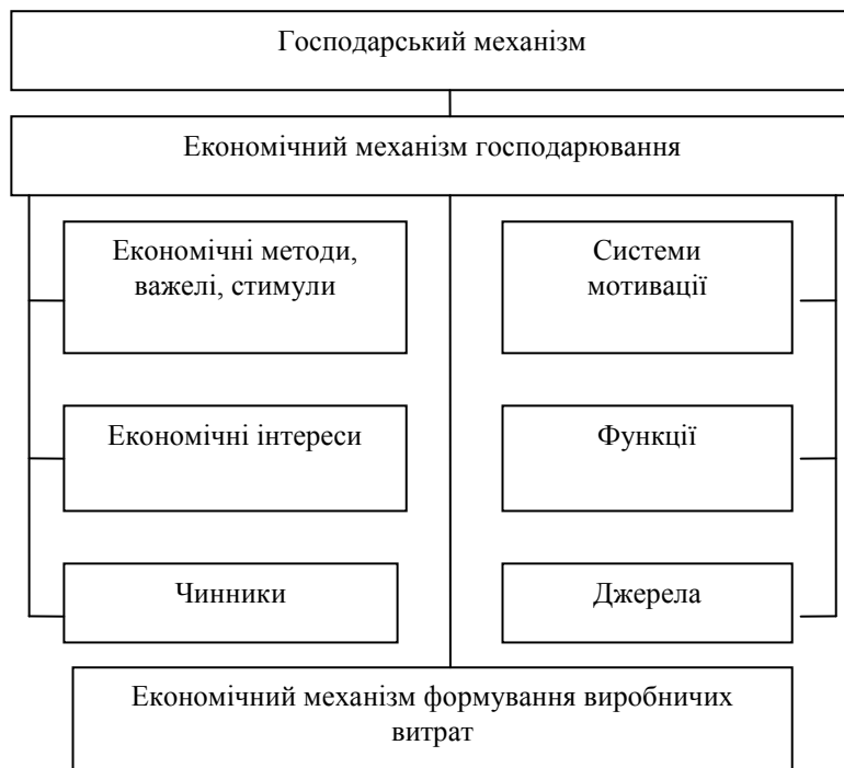
Рис. 1 Загальна схема економічного механізму господарювання