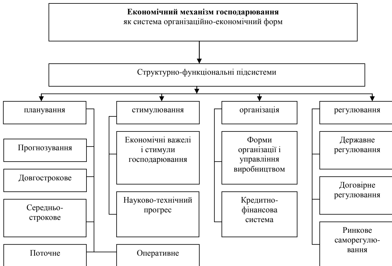
Рис. 2 Структура економічного механізму господарювання Джерело: власні дослідження