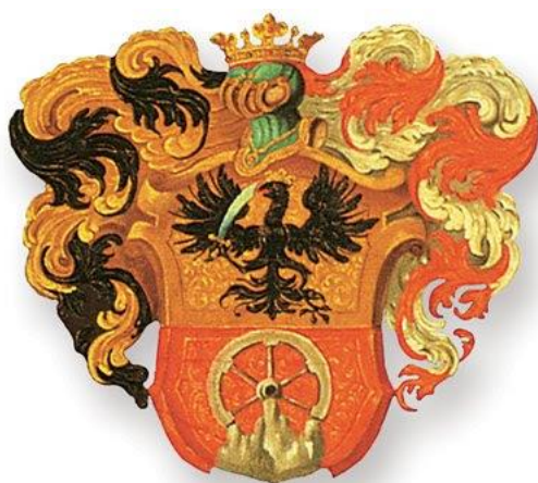
Рис. 5. Герб Ракоці