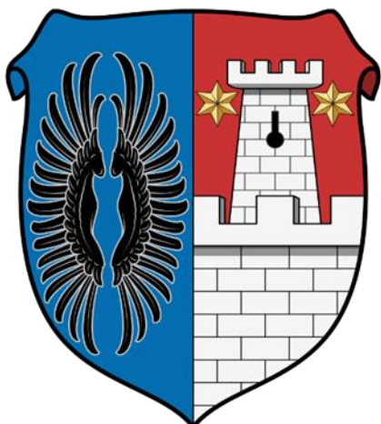
Рис. 3. Герб Зріні