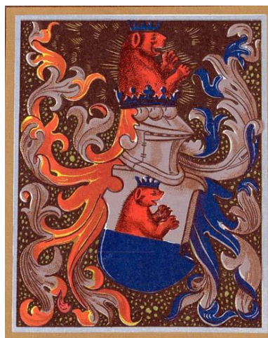
Рис. 6. Герб Терек