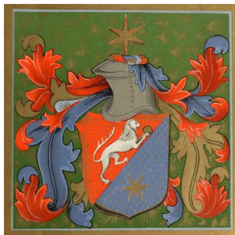
Рис. 2. Герб Довці