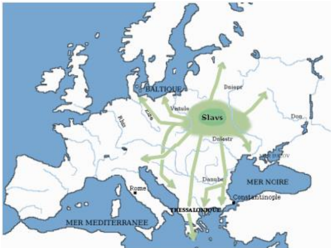
Карта 1. Прабатьківщина слов'ян