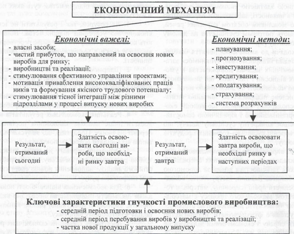
Рис. 3 Схема економічного механізму регулювання розвитку з урахуванням гнучкості промислового виробництва

товувати удосконалений економічний механізм розвитку виробництва. Економічний механізм регулювання розвитку з урахуванням гнучкості промислового виробництва можна зобразити схематично (рис. 3).