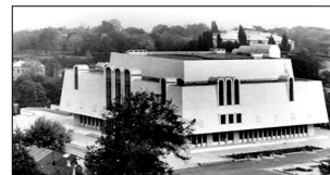
Черкаський обласний краєзнавчий музей. 1985. Арх. Л. Кондратський (співаєт.)

Закін. Київ. інж.-буд. ін-т (1963; викл. О. Тацій ). Працював від 1963 в ін-ті «Черкасиоблпроект»; від 1967 – архітектор Черкас. худож.-вироб. майстерень Худож. фонду України; від 2006 – гол. архітектор проекту приват. підпр-ва «Творча майстерня “Арх-ра”» (Черкаси). Серед реаліз. проєктів – мед. уч-ще (1964), ресторан «Славутич» (1966), Палац культури «Дружба народів» (1980), обл. краєзнав. музей (1985), реконструкція обл. філармонії (2005) у Черкасах, центр с. Матусів Шполян. р-ну (1980),