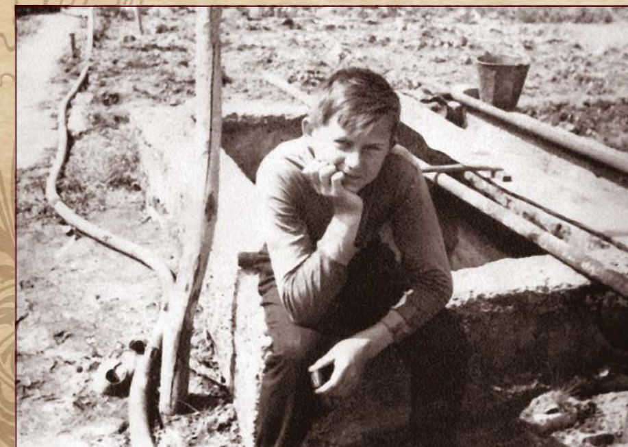
На батьківському подвір'ї у Станиці Луганській