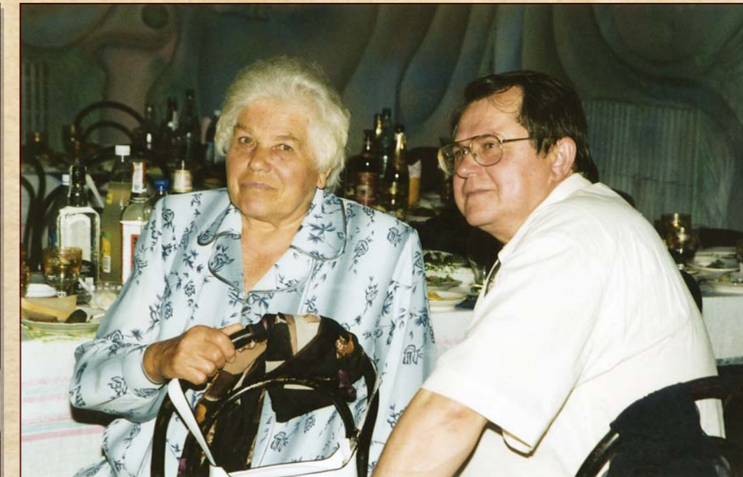
З мамою, 2003 р.