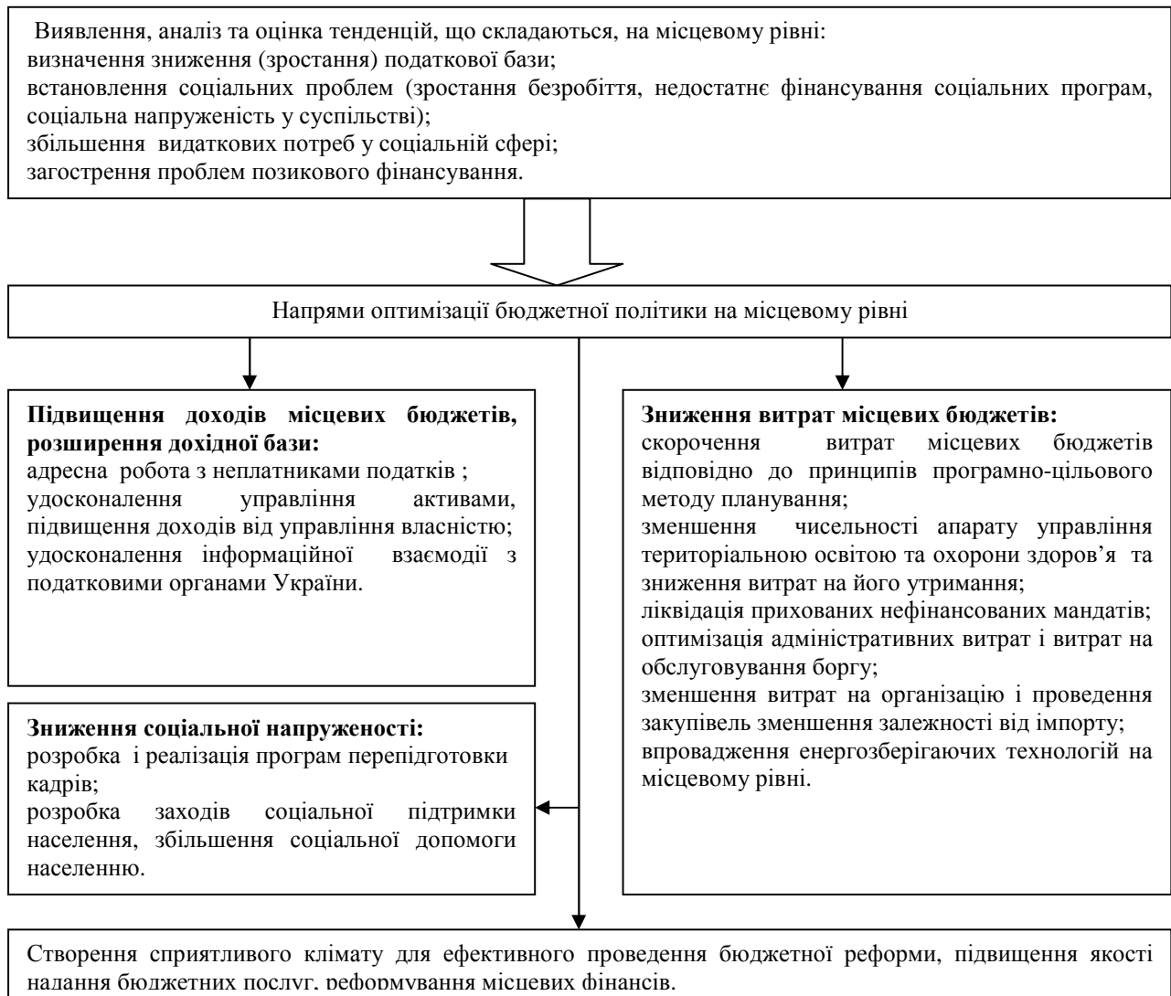
Рис. 3 Основні напрями формування ефективної бюджетної політики (складено автором)