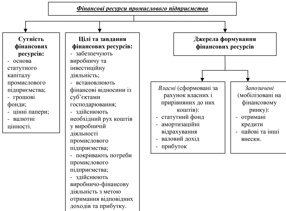
Рис. 1 Концептуальні засади фінансових ресурсів промислових підприємств

призначення або корпоративними формуваннями з централізованих фондів та позичені — отримані кредити [15, с.80].