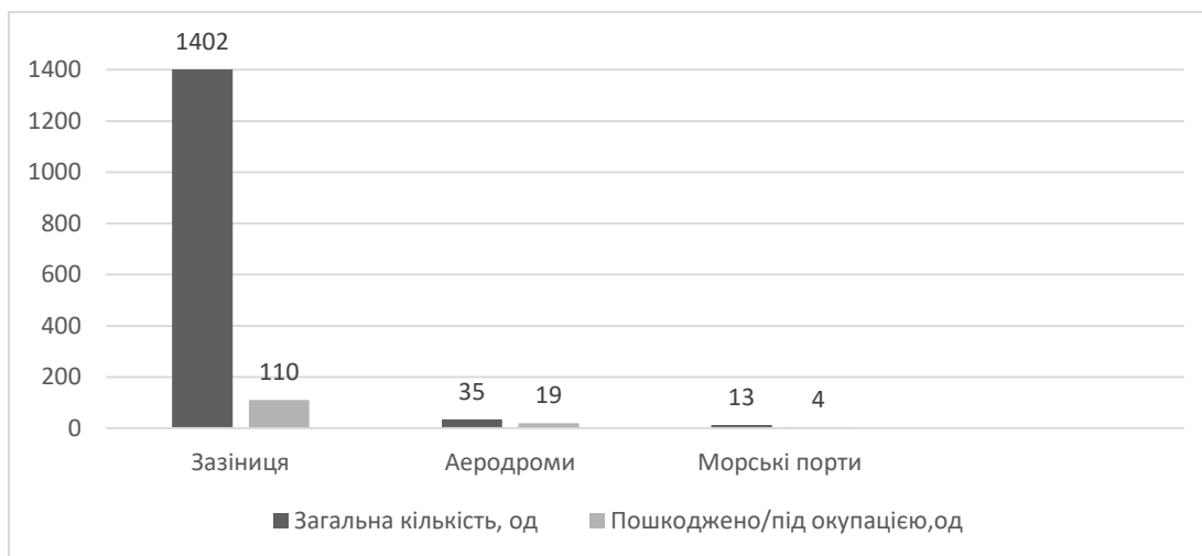
Рис.1 Співставлення логістичної інфраструктури.[5]

На Рис. 1 зображено наслідки пошкоджень української логістичної інфраструктури від російської агресії. Співставлена загальна кількість інфраструктурних одиниць, а саме авіаційна, залізнична, морські порти до кількості пошкоджених. Близько третини інфраструктури зараз перебуває в знищеному або несправному стані для здійснення діяльності. Згідно з попередніми оцінками, загальний розмір збитків від втрати інфраструктури в Україні становить $35,3 млрд, але ця цифра зростає щодня.