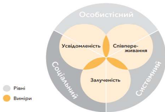
Рис.1. Рівні та виміри СЕЕН

Модель Д. Гоулмена і П. Сенге в книзі «Потрійний фокус»: увага до себе, увага до інших і увага до взаємозалежності та систем дала поштовх для формування моделі соціально-емоційного та етичного навчання (СЕЕН), яка включає в себе три рівні, а саме особистісний, соціальний та системний. Ці три рівні можуть реалізуватися в трьох вимірах: усвідомлення, співпереживання та залученість. Дана модель дозволяє нам зрозуміти, що СЕЕН передбачає, що учнівство має бути активним у всіх сферах та рівнях суспільного та особистого життя (див. рис. 1).