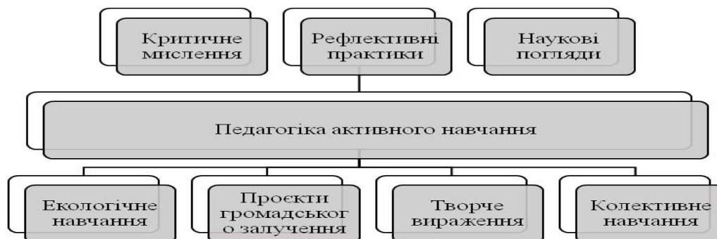
Рис.4. Навчальні рівні та траєкторії

та робити висновки. Це — єдиний спосіб пройти всі три рівні розуміння [3, с.135]. Робота педагога включає в себе три рівні та чотири, які допомагають реалізувати СЕЕН (див. рис. 4.).