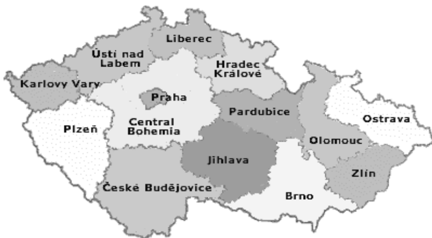
Мал. 1. Адміністративний устрій Чехії

Незважаючи на це впродовж 1996-2000 рр. у країні велися постійні дискусії стосовно концепції місцевого самоврядування. Лише у грудні 1997 р. парламент Чехії затвердив новий адміністративний устрій країни. Замість 8 регіонів було створено 14 країв ( kraj ): Центральночеський, Південночеський, Пльзеньський, Карловарський, Устецький, Ліберецький. Карловоградський, Пардубіцький, Оломоуцький, Мораво-Сілезький, Південноморавський, Злінський, Край Височіна. Місто Прага отримало статус прирівняний до статусу краю. Також було створено 6242 муніципалітети ( obec ), наразі нараховується 6244 муніципалітети [8].