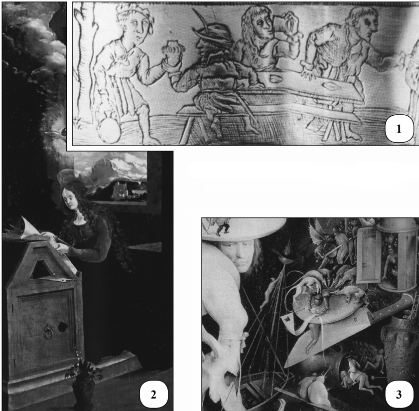
Рис. 4. Зображення стаканів лошницького типу (за Goš, 2007).

(Starý Jičín), 55. Стражнице (Strážnice), 56. Темплитин (Templýtín), 57. Товачов (Tovačov), 58. Топольчани (Topolčany), 59. Требіч (Třebíč), 60. Тренчін (Trenčín), 61. Трнавка (Trnávka), 62. Трубеліце (Troubelice), 63. Угерске Градіште (Uherske Hradiště), 64. Уданки (Udánky), 65. Унчовіце (Unčovice), 66. Усобі (Úsobí), 67. Хляб (Chláb), 68. Хрліце (Chrlice), 69. Хрудім (Chrudim), 70. Шарішські град (Šarišský hrad), 71. Штернберк (Šternberk), 72. Естергом (Esztergom), 73. Одорхеул Сікуєск, 74. Біскупіце.