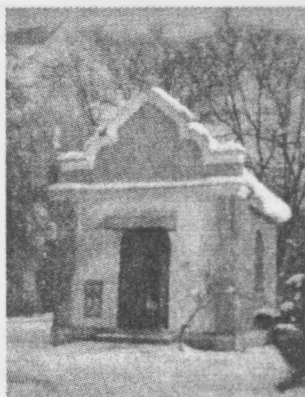
Каплиця Анці-цілительки в Заріччі

Всім нам добре відомі імена Ванги, Джуни та інших легендарних жінок, які справді лікували хворих нетрадиційними методами, давали людям добрі поради, провіщали майбутнє, часто творили на межі фантастики.