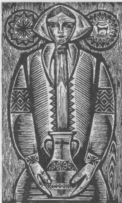
М. Митрик. Дівчина з глечиком. 1969

До тої хвили, докідь она жила як незнаюча, так робила, як другі. Потому, як мала 18 рокув, тогды была умерла на короткый час. Потому жила так, що уже не ходила по світу, усе была на хыжі на поді. Соломняна хыжа была. Там жила на поді як літо, так зиму. Як спала, пуд