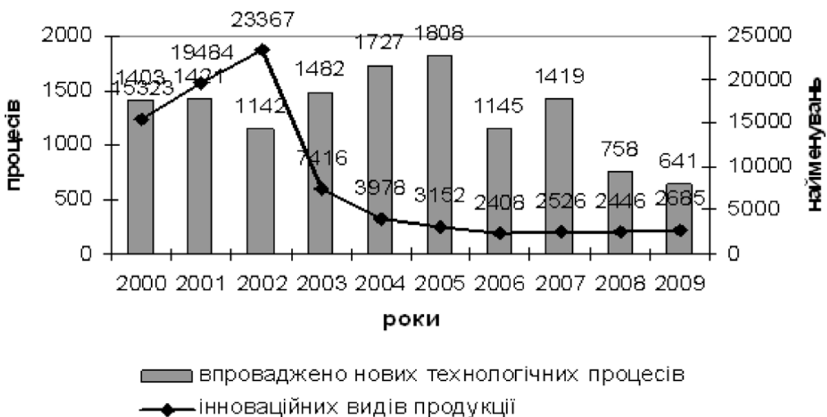
Рис. 3 Упровадження прогресивних технологій та інноваційних видів продукції

Технологічний розвиток галузей промисловості характеризується насамперед упровадженням прогресивних технологічних процесів. Про низьку інноваційну активність українських підприємств свідчить те, що в 2000 р. лише 416 промислових підприємств впроваджували нові технологічні процеси (4,1% від загальної кількості промислових підприємств), в 2007 р. – 515 (5,0%), в 2008 р. – 582 (5,4%), в 2009 р. – 452 підприємства впровадили нові технологічні процеси з метою підвищення конкурентоздатності власного виробництва. Загалом упровадження прогресивних технологій не характеризується особливою стабільністю, про що свідчить рис. 3.