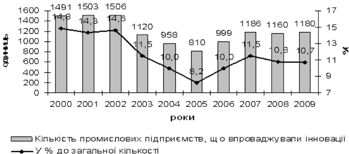
Рис. 2 Кількість промислових підприємств, що впроваджували інновації та їх частка в загальній кількості промислових підприємств України [4, с. 231]

Починаючи з 2000р., кількість підприємств, що впроваджували інновації, постійно зменшувалася, за виключенням 2002 р., коли їх кількість збільшилася на 0,3% (рис. 2). В 2005 р. спостерігався рекордно низький рівень промислових підприємств, які займалися впровадженням інновацій – лише 8,2% від загальної їх кількості.