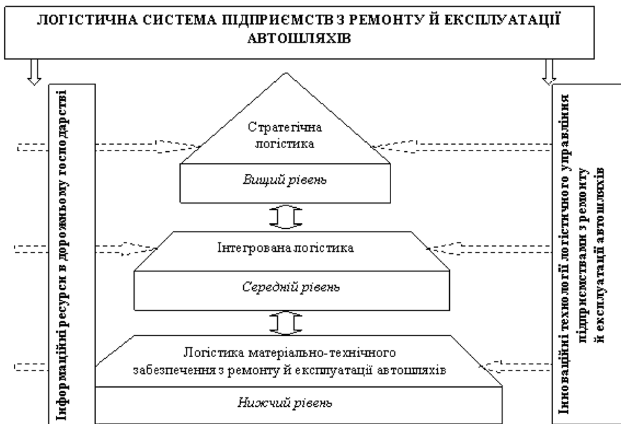
Рис. 2 Модель використання і функціонування інноваційно-логістичної системи підприємствами з ремонту й експлуатації автошляхів

логістика – пов’язує в єдине ціле споживачів та виробників [4]. Кінцевий результат стратегічної логістики – це зменшення затрат часу на операції всередині ремонтно-будівельного підприємства та збільшення – на взаємодію із споживачами; другий рівень (середній) – інтегрована логістика – елементи внутріфірмових систем ремонтно-будівельних підприємств, а саме підсистем планування, закупівель, виробництва, зберігання, транспортування, розподілу і контролю, котрі функціонують як єдиний чітко налагоджений механізм системи ремонту й експлуатації автошляхів; третій рівень (нижчий) – логістика матеріально-технічного забезпечення ремонту й експлуатації автошляхів – передбачає наскрізне управління логістичними потоками у системах за різних співвідношень їх характеристик, траєкторії руху, часу початку руху та просування через окремі пункти ремонтно-будівельних підприємств (рис. 2).