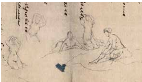
Рис. 3. Т.Г. Шевченко. Начерки на полях рукопису балади «Русалка»

Десь у березні 1859 р. Шевченко мав можливість спробувати свої сили у фресці, адже П. Кочубей доручив йому розписати стіни свого дому на березі Неви в Петербурзі. Композицію не здійснив, але зготував ескізи, з яких дійшла до нас ескізна картина «Русалки» (Див. рис. 1). Роботу виконано на папері, на звороті внизу чорнилом напис «Русалки на Дніпрі», сюжетною основою є тема «Як русалки місяць ловлять». Є три етюди до цього малюнка під назвою «Русалка» (Див. рис. 4). Центральна група згаданої картини складається з трьох русалок. Вони, як три грації, несуться кругом місяця. Дві мають розпущені коси, одна заплетена у дві коси, перевиті за українським звичаєм стрічками. Середня русалка тримає в руках накривало, що напнуло під опорою повітря. Це все відбувається в повітрі, а знизу річка Дніпро, у якій видно теж русалок. Одна русалка цілує козака, що потопав, від якого сплила шапка на воді, а інші виринають із води й плывуть до байдака. Та русалка, яка затоплює козака, плутається у водяних заростах. Далеко видно силует берега й будинків [29, с. 282]. Цей зміст картини нагадує баладу «Причинна»: «Місяченьку! / Наш голубоньку! Ходи до нас вече-