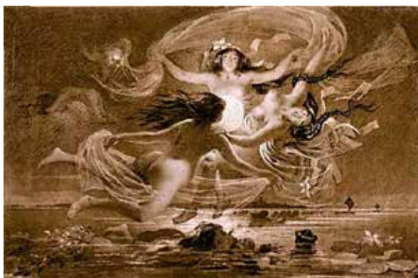
Рис. 1. Т.Г. Шевченко. «Русалки»

Це народна русальна пісня, записана М. Максимовичем [18] ще до створення Шевченком балади «Причинна», яку співають русалки, народжені на землі, коли виходять із води на весь Зелений тиждень. Зелений, або Русальний,