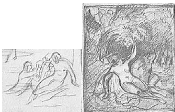
Рис. 2. Т.Г. Шевченко. Ескіз до поеми «Утоплена»

З усіх балад Шевченка, на нашу думку, найбільш перейнята романтичною фантастикою балада «Утоплена». Сюжет балади віддзеркалює в літературі народні уявлення про потойбічне життя, але Шевченко дещо змінює традиційний погляд. Усі герої балади (дівчина, закоханий у неї рибалка, мати) стають русалками. У нічну пору зі ставка, зарослого осокою та прозваного заклятим, випливають утоплениці – дочка і мати та молодий рибалка, що пішов «жити у воду». Дослідники