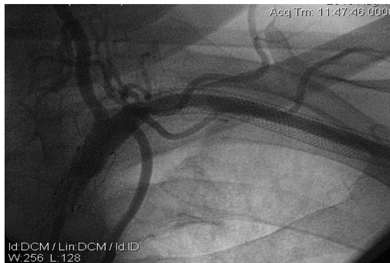
Рис. 3. Контрольна ангиографія хворого Б. Задовільне заповнення лівої ПкА та її гілок після балонної дилатації ураженого сегменту ПкА.

У групі хворих після відкритих операційних втручань реоклюзія/ретромбоз реконструйованої зони настали в 3 пацієнтів протягом 5 років і, таким чином, стабільні результати хірургічного лікування ХІВК, зумовленої синдромом підключично-хребтового обкрадання, знизилися зі 100% до 75%. У 2 пацієнтів виконано тромбектомію із сонно-підключичного шунта, в результаті вдалося відновити кровопотік на верхній кінцівці, у одного пацієнта реоклюзія ПкА носила безсимптомний характер, симптоми ішемії верхніх кінцівок не наростали.