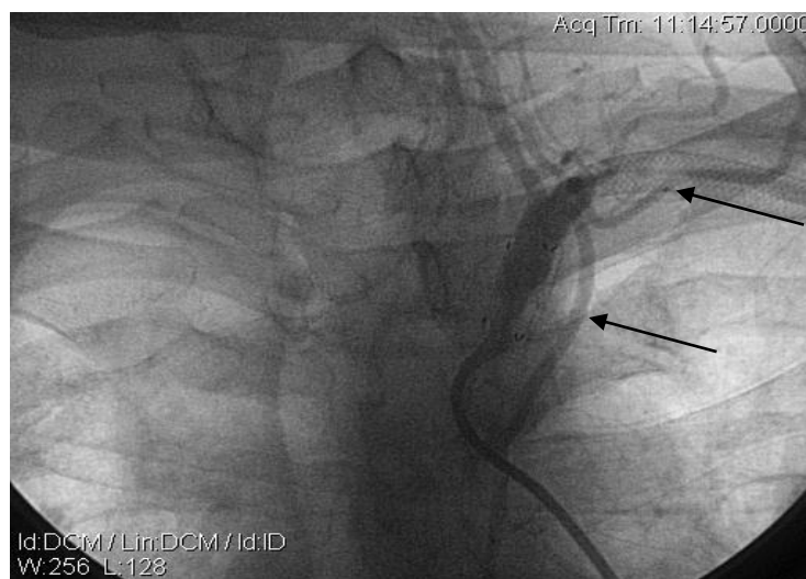
Рис. 2. Рентгенконтрастна ангіографія хворого Б. Візуалізується рестеноз в стентах ПкА (вказаний стрілками)

Враховуючи той факт, що результати операційного лікування залежать від виду хірургічних втручань (ендovasкулярних або відкритих), ми провели аналіз віддалених результатів у кожній групі окремо. Стабільні результати хірургічного лікування XIBK, викликаного синдромом підключично-хребтового обкрадання, у хворих після ендovasкулярних втручань протягом першого року спостереження становили 100%, а потім один рестеноз в стенті зменшив відсоток добрих та задовільних результатів до 96%. Даному пацієнту виконано повторну дилатацію лівої ПкА, в результаті відновлено кровопотік на лівій верхній кінцівці.