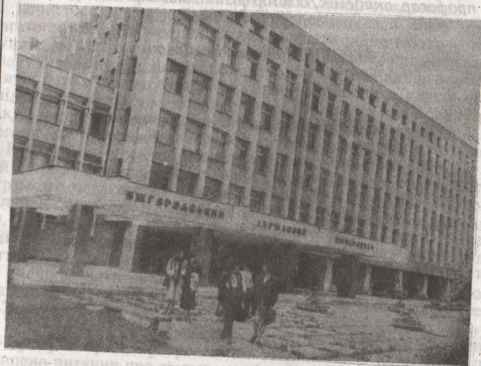
УЖГОРОД - 1997