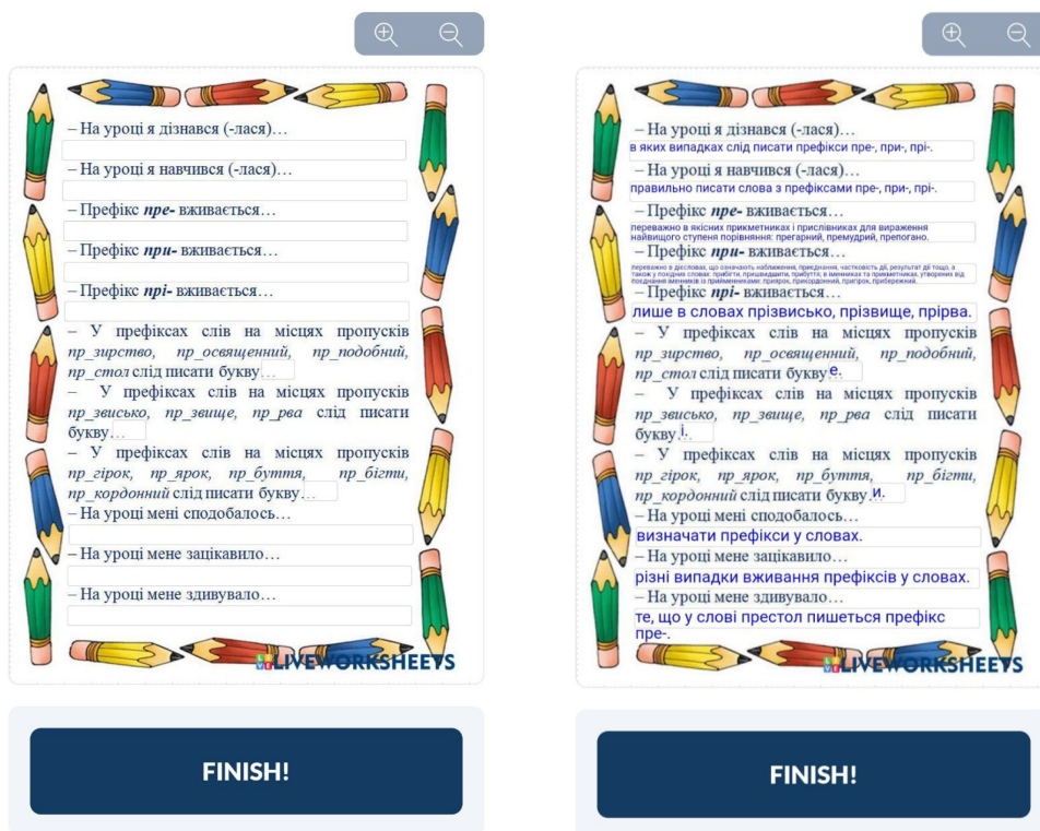
Рис. 17–18. Приклад використання інтерактивного методу навчання «Незакінчені речення» у програмі LiveWorksheets на уроках української мови

гами та студентами-практикантами гуманітарних факультетів вищих навчальних закладів, зокрема й під час проходження педагогічної практики.