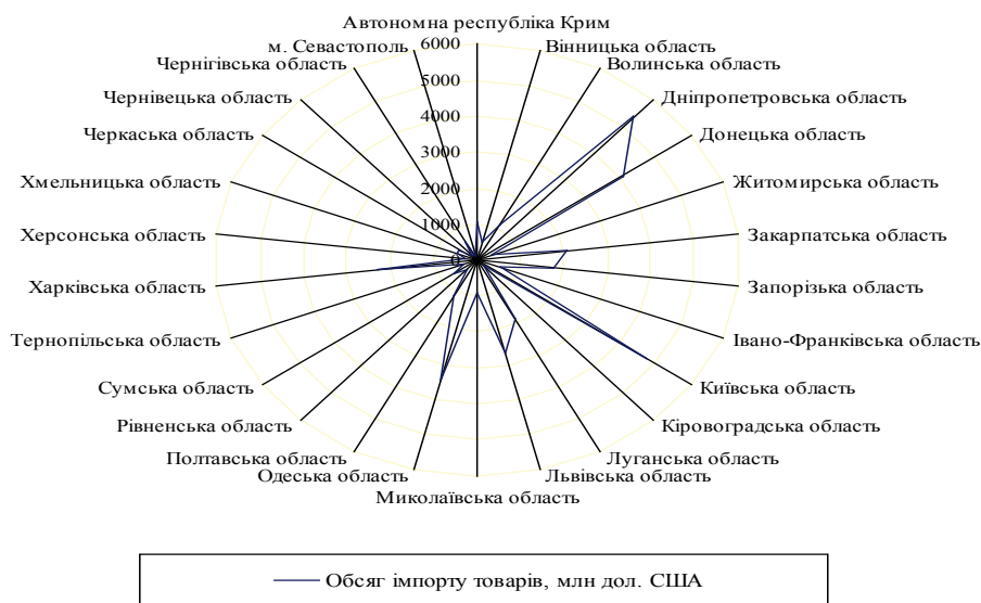
Рис. 1. Обсяг імпорту товарів регіонами України у 2013 році [6]

Зовнішньоекономічний потенціал регіону як складова регіональної конкурентоспроможності представляє собою здатності та можливості підприємств регіону здійснювати за позитивною динамікою експортно-імпорتنі операції. При цьому динаміка повинна мати випереджальний характер у порівнянні з суб'єктами інших регіональних об'єднань. Лише за умови інтенсивної темпоральності позитивного тренду зовнішньоекономічної діяльності регіон забезпечує