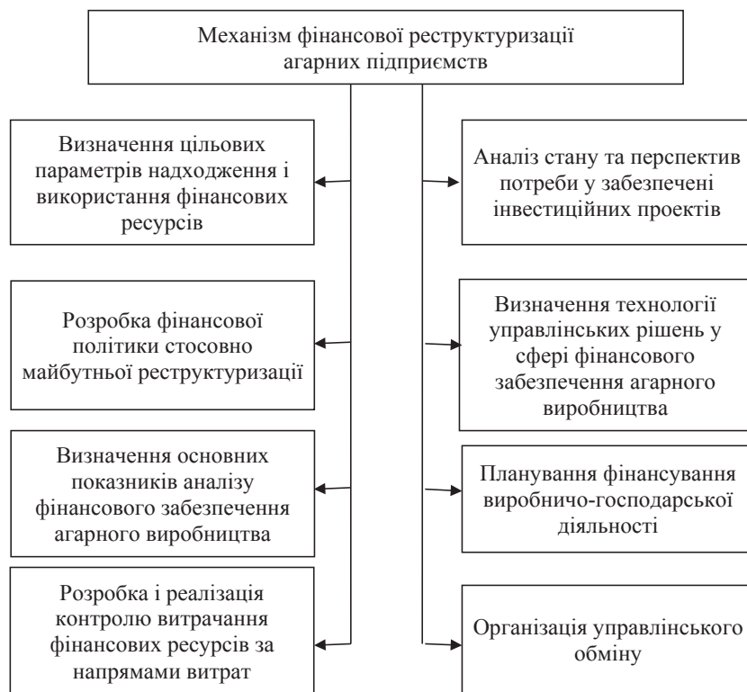
Рис. 4. Структура та зміст фінансового механізму реструктуризації аграрних підприємств

Водночас широкого розповсюдження в аграрних формуваннях набула комерційна інформація, покликана не стільки бажанням політики менеджменту, скільки прагненням приховати інформацію про реальний стан справ з метою мінімізації податків, що сплачуються. Фактично інформація про рух фінансових і товарних потоків в аграрних підприємствах є недостатньою як для органів управління усіх ієрархічних рівнів, так і для наукових досліджень з аграрної проблематики. На практиці це виявляється у формуванні особливої інформаційної бази, спрямованої на збереження комерційної таємниці, збереження тіньових схем господарювання, які вимірюються за допомогою особливих методів і не піддаються виміру за однорідними показниками. Удосконалення інформаційного забезпечення реструктуризації підприємства АПК на перспективу вбачається в безумовній акумуляції масивів даних господарської діяльності за такими напрямками: про стан розвитку аграрної економіки загалом; про результати господарської діяльності галузей, підприємств і виробництв АПК за напрямками спеціалізації; про забезпечення асортиментом продовольчої продукції власного виробництва в регіональному розрізі; про міжрегіональні поставки продовольства в рамках функціонування спільного аграрного ринку; про експорт та