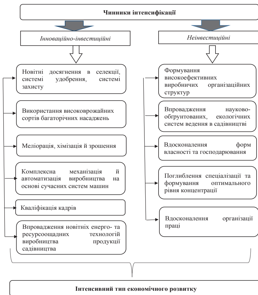
Рис. 4. Чинники формування інтенсивного типу економічного розвитку в сільськогосподарських підприємствах

Формування інтенсивного типу розвитку садівничих підприємств можливе за обґрунтування оптимальних параметрів різних організаційно-правових форм господарювання. До садівничих підприємств належать державні