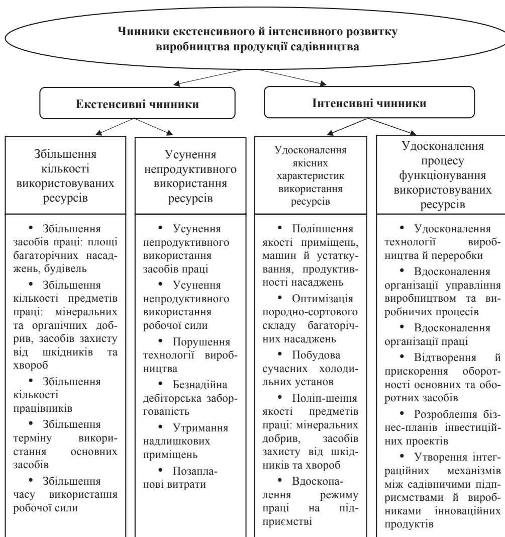
Рис. 1. Екстенсивні й інтенсивні чинники розвитку виробництва продукції садівництва

шення продуктивних якостей функціонуючих основних засобів виробництва та предметів праці, породно-сортового складу насаджень, технологій виробництва, промислового перероблення, довготривалого зберігання плодів і ягід, у прискоренні всіх процесів відтворення, удосконаленні організаційних структур суб'єктів ринку плодів та ягід, форм організації й оплати праці. У зв'язку із цим під-