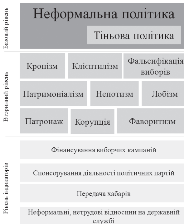
Рис 1. Неформальна політика: структура концепту

Висновки. Тіньова політика та неформальна політика – феномени, до яких значно зріс інтерес науковців у другій третині ХХ століття. Не зважаючи, на близькість термінів, неформальна та тіньова політика – не тотожні поняття, що позначають різні явища. Неформальна політика є ширшим за обсягом поняттям, оскільки включає не лише «негативний» бік політичного процесу – наприклад, корупцію, непотизм, але й ціннісно-нейтральні, контекст-залежні феномени, що можуть мати позитивний вплив на функціонування політичної системи. Тіньова політика здебільшого вживається для позначення однозначно негативних проявів взаємодії акторів у політичному процесі. Неформальна політика – концепт, що має складну структуру: базовий, теоретичний рівень, рівень конститутивних вимірів та рівень індикаторів. Найбільш дослідженим у літературі є вторинний рівень та рівень конститутивних вимірів: опублікована значна кількість теоретичних досліджень корупції, лобізму, непотизму, тощо, знайдені емпіричні індикатори вимірювання цих феноменів. Перспектива подальших досліджень лежить в площині детального аналізу «неформальної політики» на базовому, теоретичному рівні.