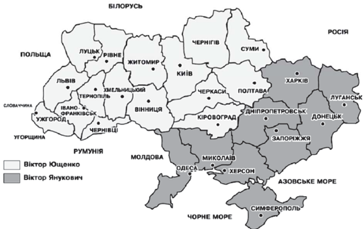
Переможці по областях на президентських виборах 2004 р. [3, с.88].

Радикальна політизація регіональних ідентифікаційних питань в ході трьохтурової президентської виборчої кампанії 2004-2005 рр. і т.зв. «Помаранчевої революції» дозволила спекулятивно використовувати регіональні відмінності в формулюваннях про політичний розкол України.