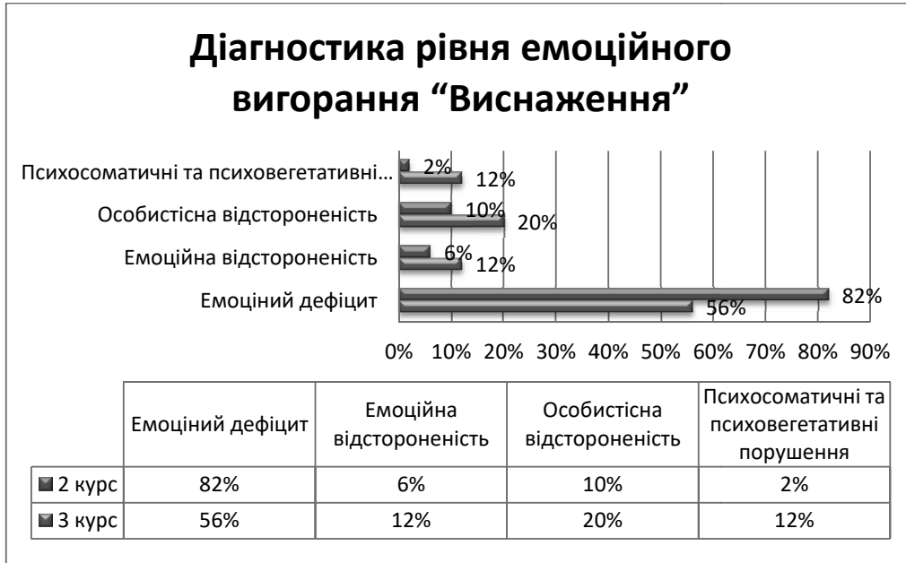
Рис. 4. Дослідження провідних симптомів фази «Виснаження».

Оцінка рівня тривожності виявила високий рівень ситуативної та особистісної тривожності у студентів третього курсу – 74% і 70% відповідно. Для студентів другого курсу характерні середні рівні: у 72% – середній рівень особистісної тривожності, у 50% – середній і 46% опитуваних – високий рівень ситуативної тривожності.