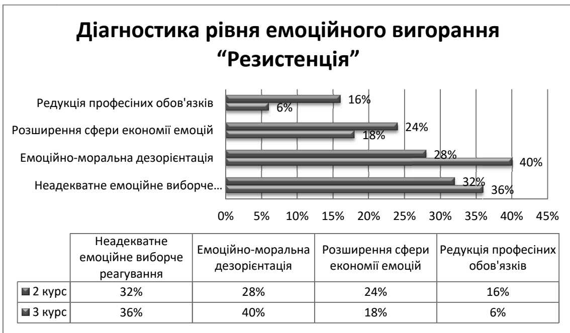
Рис. 3. Дослідження провідних симптомів фази «Резистенції».

борче реагування, що проявилися у 32% опитаних другокурсників і 36% третьокурсників (рис. 3).