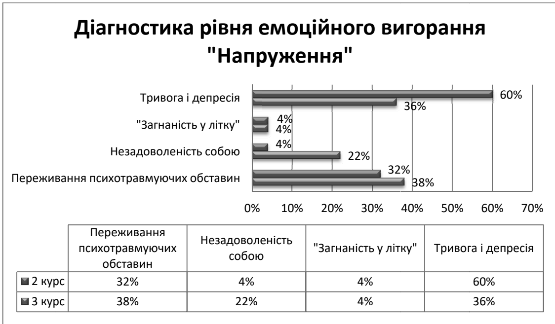
Рис. 2. Дослідження провідних симптомів фази «Напруження».

Для фази резистентності провідними симптомами є емоційно-моральна дезорієнтація (у 28% другого та 40% студентів третього курсів) та неадекватне емоційне ви-