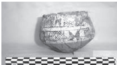
Рис. 1. Расписной сосуд из кургана Гасансу

и орнамента хорошо известны из памятников Нахчывана [6, Çizim 15, 7] и Восточной Анатолии [8, Levha 77]. Третий сосуд представлен кувшином округлой формы с цилиндрическим горлом. Орнаментирован над красным ангобом черным цветом (рис. 2, 1). Орнаментальный мотив этого кувшина известен из поселения Кюльтепе II [6, Çizim 11, 5], некрополя Шортеле [6, Çizim 15, 1, 2], Узерликтепе [13, Рис. 58] и памятников Араратской долины [13, Рис. 59, 2–3, 10].