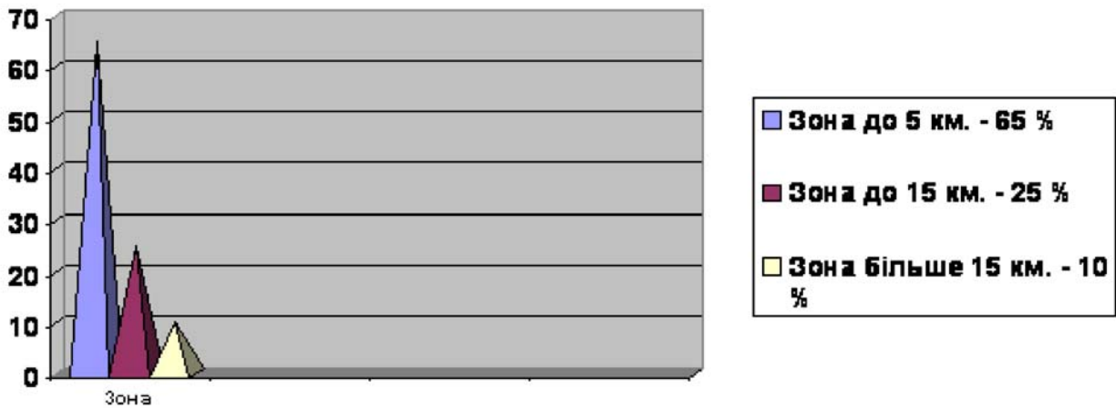
Рис. 1 Структура маятникових міграцій населення із “зон притягання”

Чисельність наявного населення та масштаби прибуття та вибуття населення в розрізі природноекономічних зон Закарпатської області, характеризує нижче наведена таблиця 2.