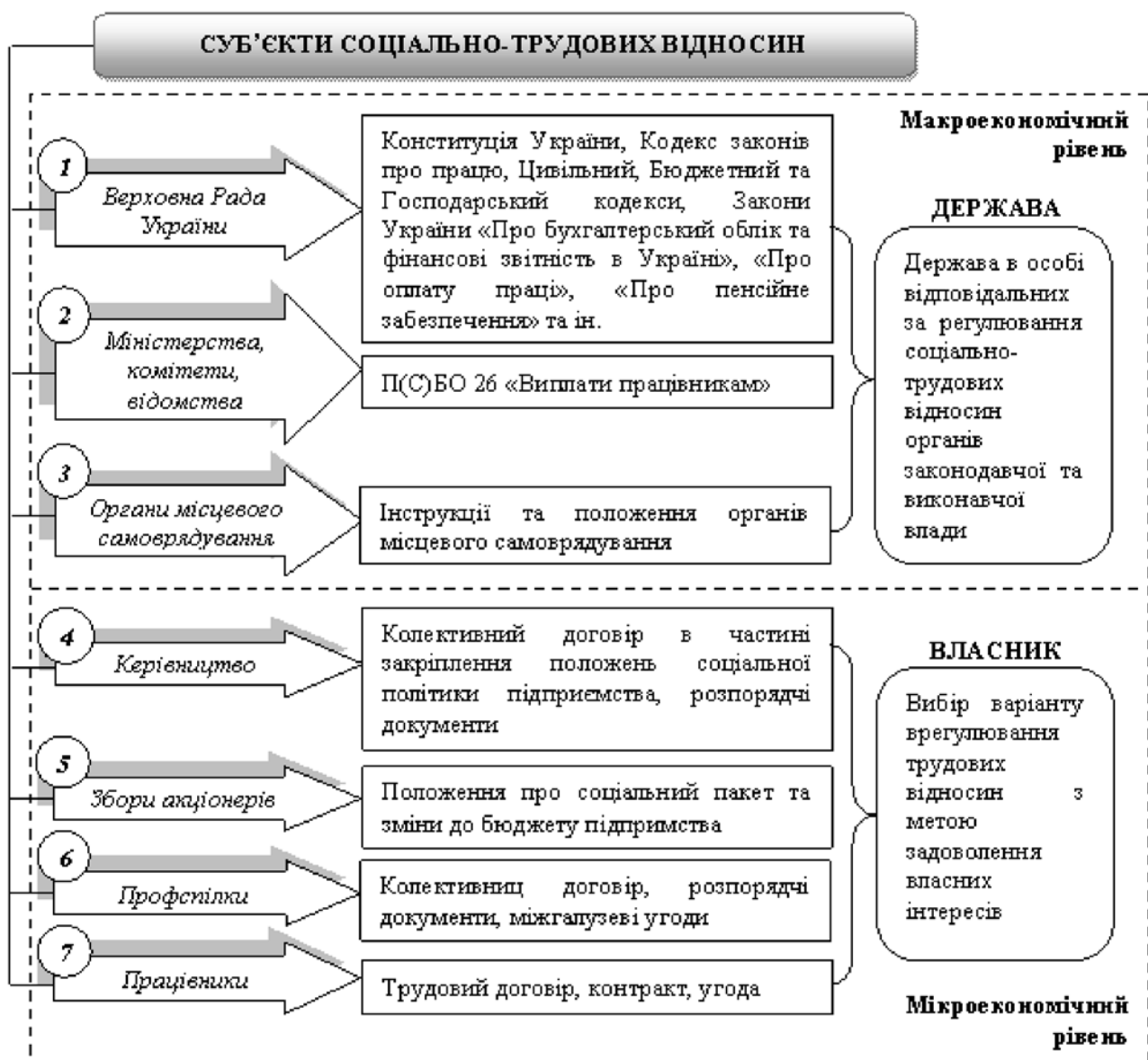
Рис. 2 Суб'єкти соціально-трудових відносин: ієрархічний розріз

Перехід від планово-адміністративної економіки до економіки ринкового типу неминуче пов'язаний з необхідністю прийняття рішень щодо дій держави в контексті врегулювання соціально-трудових відносин. Законодавча та виконавча влада повинна стимулювати інтереси власників бізнес-одиниць, щоб забезпечити необхідну як соціальну, так і економічну реконструкцію. Роль системи бухгалтерського обліку як економіко-соціального інституту залежить від особливостей державного регулювання трудових відносин в сучасних умовах господарювання. З огляду на це розглянемо нормативне регулювання облікового відображення соціально-трудових відносин на різних рівнях суспільних утворень (рис. 2).