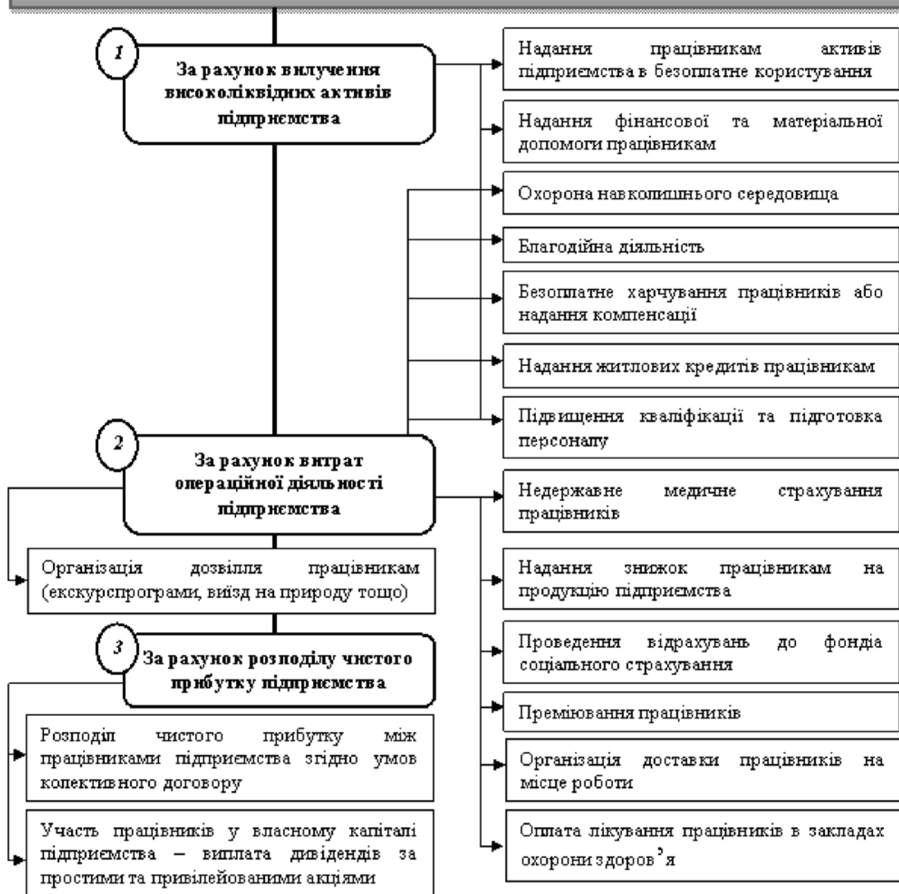
Рис. 4 Напрями соціальної діяльності суб'єкта мікрорівня за способом використання майна підприємства

Визначені напрями соціальної діяльності суб'єкта господарювання дозволять належним чином організувати аналітичні розрізи в системі бухгалтерського обліку, що підвищить інформативність даної системи, та створить базу для прийняття виважених управлінських рішень в частині узгодження інтересів суб'єктів праці.