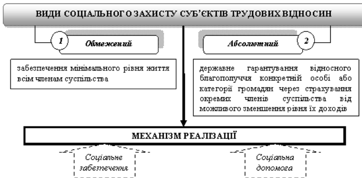
Рис. 1 Види соціального захисту суб'єктів трудових відносин та механізм його реалізації

З точки зору трудового внеску в суспільне виробництво, виділяють два види соціального захисту: обмежений і абсолютний. Соціальний захист суб'єктів трудових відносин здійснюється через реалізацію системи механізмів (рис. 1).