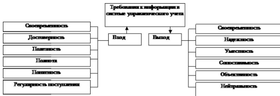
Рисунок 2 Требования к информации в системе управленческого учета

стратегических целей. Это возможно лишь при научной организации информационных потоков на предприятии. Так как управленческий учет является основным поставщиком информации, необходимой для функционирования системы управления на предприятии, учетно-аналитическая информация управленческого учета должна отвечать определенным требованиям (рис. 2).