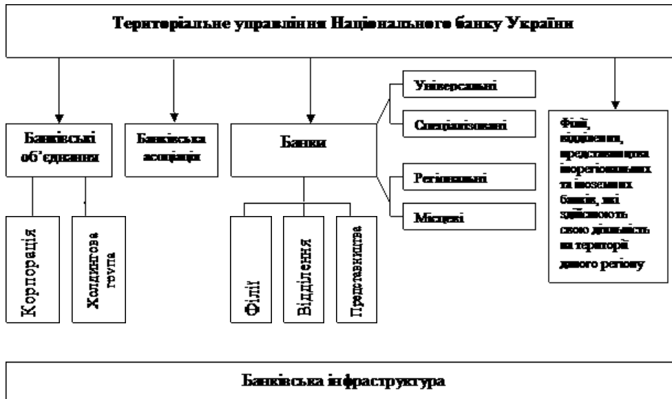
Рис 1 Організаційна структура регіональної банківської системи*