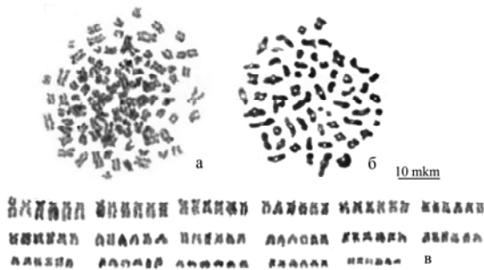
Рис. 3. Кариотип D. rubidus f. tenuis : а – митотическая метафаза ( 6n=102 ) (г. Винница); б – диакинез ( n=61 ) (г. Житомир); в – кариограмма, иллюстрирующая ранжированные по величине группы гомологичных хромосом метафазной пластинки.