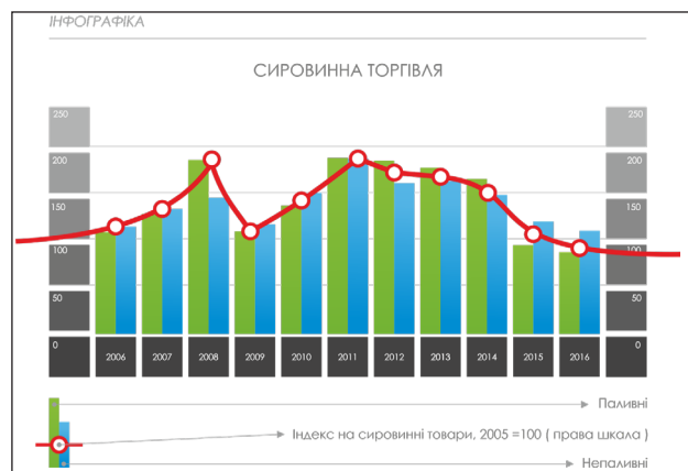
Рис. 2. Сировинна торгівля