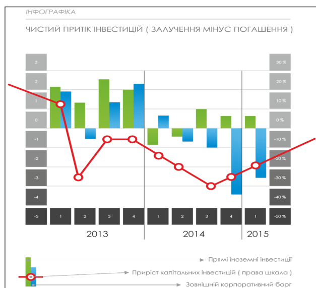
Рис. 1. Чистий притік інвестицій

Нижченаведена інфографіка свідчить, що вже декілька років відбувається відтік капіталу з економіки країни, який вимиває ресурс для інвестування, доступний підприємствам та економіці в цілому, і перетворився на один із головних факторів падіння капіталовкладень . У 2014–2015 рр. відбулося зменшення загального значення залучених ПІІ в Україну на 14,8 млрд. дол. США (з 58,2 млрд. дол. США станом на 31.12.2013 р. до 43,4 млрд. дол. США станом на 31.12.2015 р.) [6]. Країну залишає валюта, якої й без того мало, а на додаток для купівлі цієї валюти підприємства використовують акумульовану гривню, яка після обміну на певну валюту вилучається з економічного кругообігу і робить свій внесок у падіння економіки. Але якщо раніше Україна мала дефіцит торговельного балансу, витрачаючи золотовалютні резерви і зв'язуючи гривневу масу купівлею валюти під імпорнтні операції, то зараз дефіциту немає. Обсяг ПІІ у розрахунку на одного жителя в Україні, який упродовж 2010–2014 рр. коливався в діапазоні 900–1328 дол. США [6], залишається найменшим серед країн Європи і СНД, зокрема в Чехії цей показник перевищує 7 тис. дол. США, у Болгарії – 6 тис. дол. США, у Казахстані – 3 тис. дол. США [7].