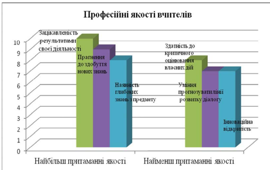
Рис. 2. Результати дослідження професійних якостей вчителів початкових класів

Такі професійні якості сучасних вчителів, як зацікавленість результатами своєї діяльності, прагнення до здобуття нових знань, наявність глибоких знань з предмету свідчать про знання історичних та концептуальних засад навчального співробітництва, технологій його реалізації. Інноваційна відкритість, уміння прогнозувати лінії розвитку діалогу, здатність до критичного оцінювання власних дій свідчать про рівень готовності вчителів до нововведень, мистецтво управління педагогічною взаємодією (рис. 2).