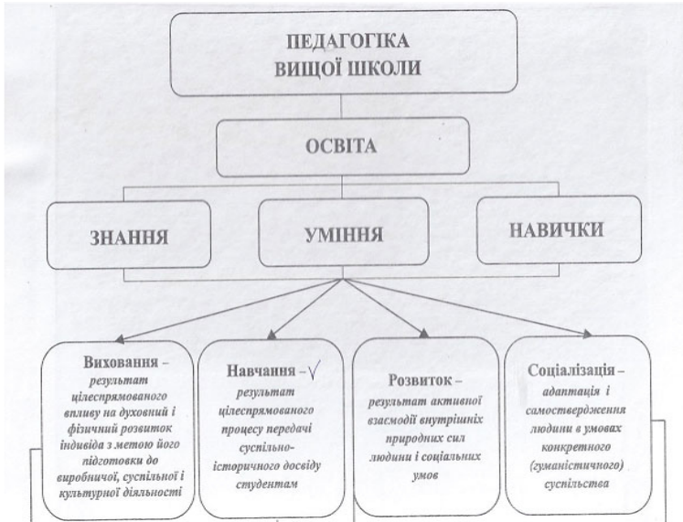
Рис.1. Структурна схема педагогічної системи вищої школи [1].

Якщо говорити про структуру педагогіки вищої школи, то, як відомо, вона включає чітко виражені складові (рис1).