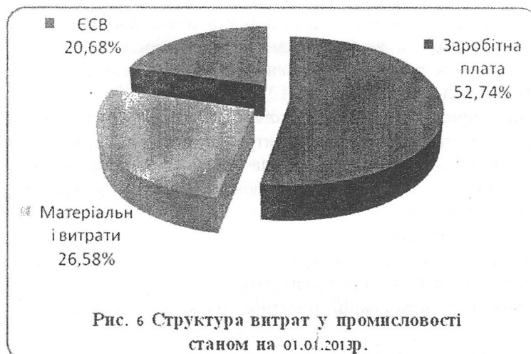
Рис. 6 Структура витрат у промисловості станом на 01.01.2013р.