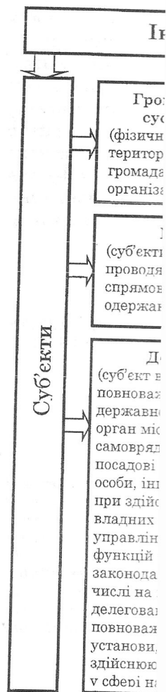
Рисунок 3 -

Ще одним док конкуренція – д волонтери що ри жодних вказівок.