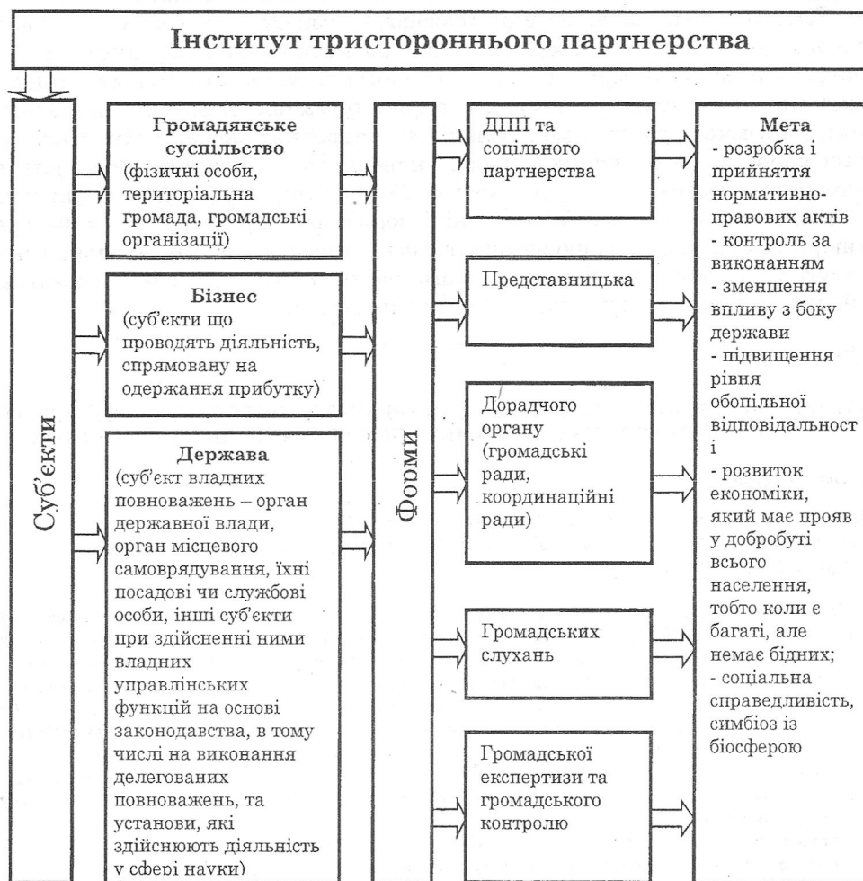
Рисунок 3 - Механізм взаємодії основних суб'єктів економічних відносин тристороннього партнерства

зазначених стосунках не було конкуренції. Об'єднання були створені не за наказом уряду, а через почуття обов'язку перед своїми співгромадянами та країною.