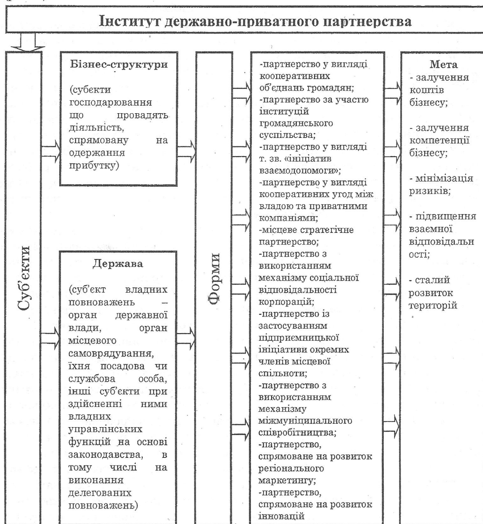
Рисунок 2 - Механізм взаємодії основних суб'єктів економічних відносин державно-приватного партнерства

Державно-приватне партнерство – складний як з організаційної, так і з фінансової та правової точки зору інститут. Він включає в себе багатосторонні домовленості, розподіл ризиків, аналіз комерційних перспектив, індивідуальні схеми фінансування та юридичного втілення (рис. 2).