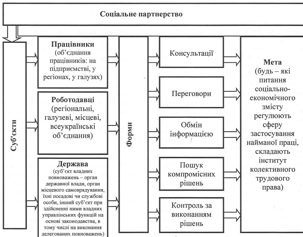
Рис. 1. Соціальне партнерство як механізм реалізації регулювання трудового права

виробництва на підставі об'єднання активів держави з приватного сектору. інвестиційними, управлінськими та іншими ресурсами