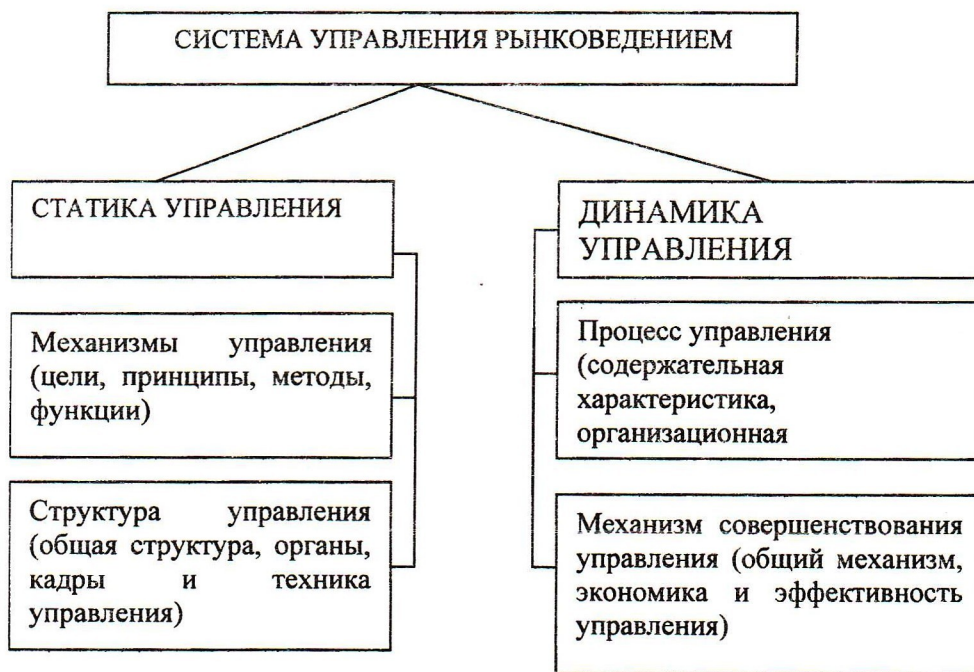
Рис.2. Схема системы управления рыноководением

Сущность рыноководческого управления определяет формирование и функционирование этого управления как системы (рис.2). Система рыноководческого управления как компонента управления предпринимательством включает разделы: механизм управления; структура управления; процесс управления; механизм совершенствования управления.