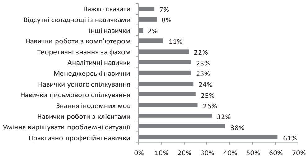
Рис. 3 Результати оцінки якості підготовки молодих спеціалістів за рівнем володіння професійних навичок.

недостатню кількість практичних навичок у випускників скаржилися 61% усіх роботодавців, на відсутність уміння вирішувати проблемні ситуації вказали 38%, а про те, що молодим спеціалістам бракує навичок роботи з клієнтами зауважили 32% опитаних (рис. 3).